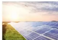
Energy Storage System