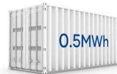
Standard 20ft containers

7 de may. de 2025 · Banco de baterías del sistema de energía solar DIY: Guía práctica con baterías LiFePO4 de 51,2 V y 100 Ah Construya su propio sistema de energía solar es una forma de ganar independencia ...