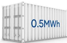
Standard 20ft containers