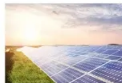
Energy Storage System