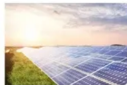
Energy Storage System