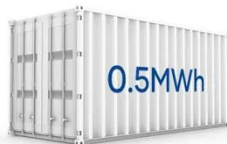
Standard 20ft containers