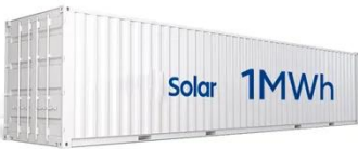
Standard 40ft containers