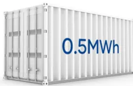
Standard 20ft containers