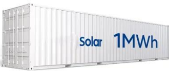
Standard 40ft containers