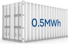
Standard 20ft containers